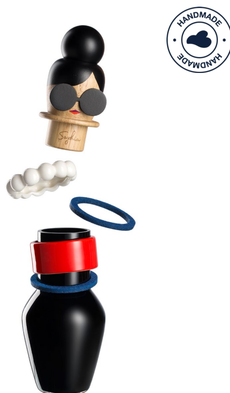
BUONI AMICI - SOPHIA